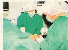
Die OP unter örtlicher Betäubung dauert 60 Minuten